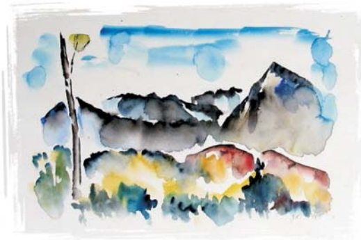
Aquarell: Bosco Gurin, 1924